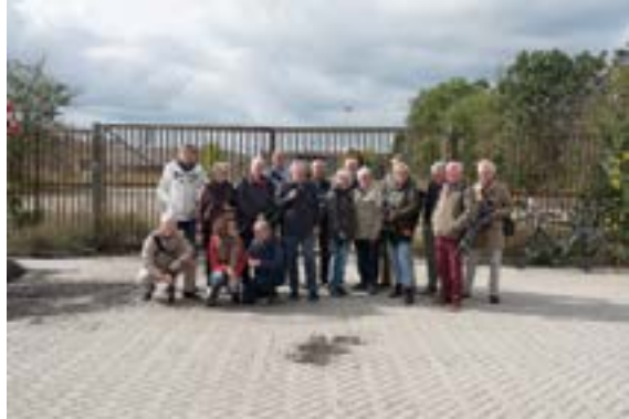
OKTOBER: bezoek aan Loveld terrein