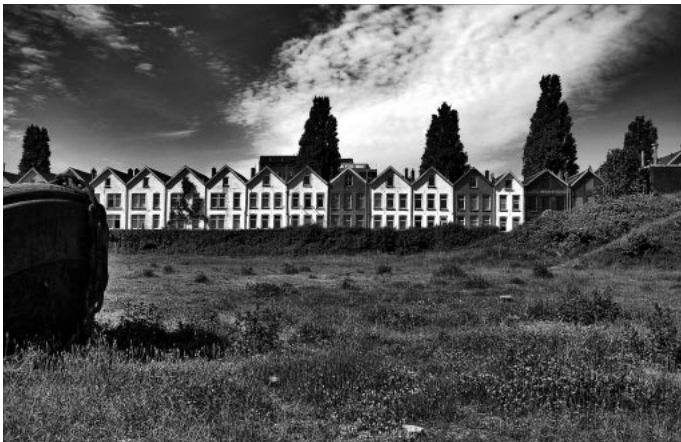
René van Rijswijk