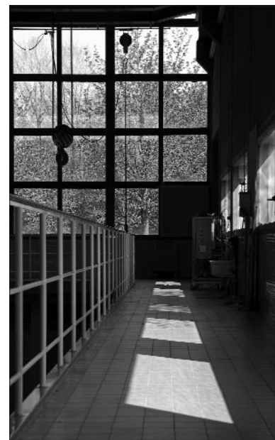
Cees van Meerten

Iedere maand een nieuwe tentoonstelling. En dat al jaren lang. Het is haast niet te geloven. En laten we eerlijk zijn, er zitten vaak echte juweeltjes bij. Dat dit niet altijd goed doordringt tot de buitenwereld is spijtig, maar niet echt ons probleem. Hierbij een overzicht van dit afgelopen fotoseizoen: