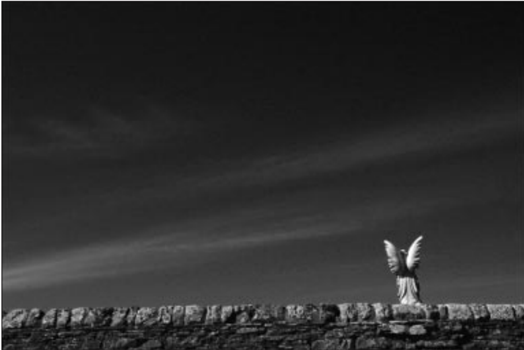
Theo de Jong