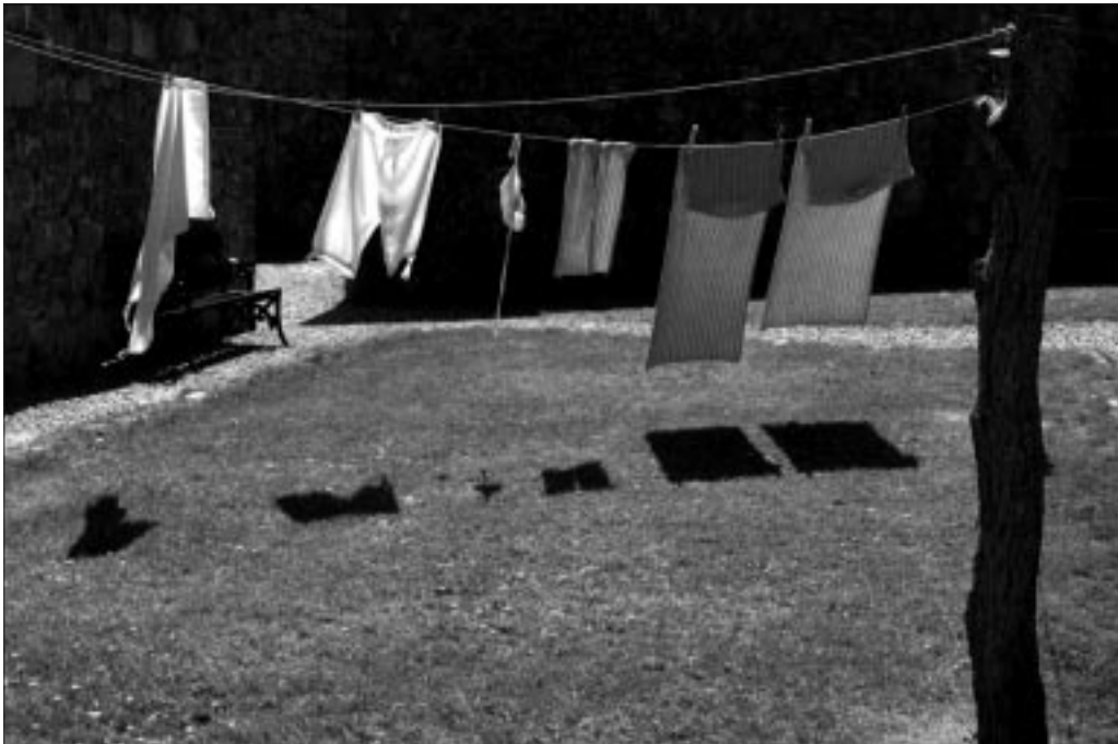
Theo de Jong