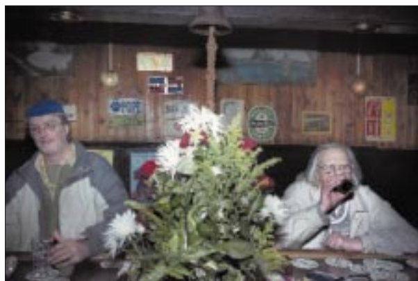
De Kleine Witte, West Kuiskade

Van 16 december t/m 18 april exposeert het Historisch Museum de kroegfoto's 'De laatste ronde' van Otto Snoek in De Dubbele Palmboom, Voorhaven 12, Rotterdam-Delfshaven.