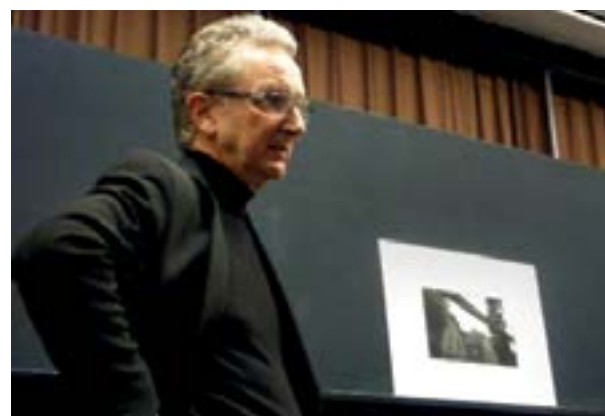
© SIMON OPHOF "OVER FOTO'S GESPROKEN"