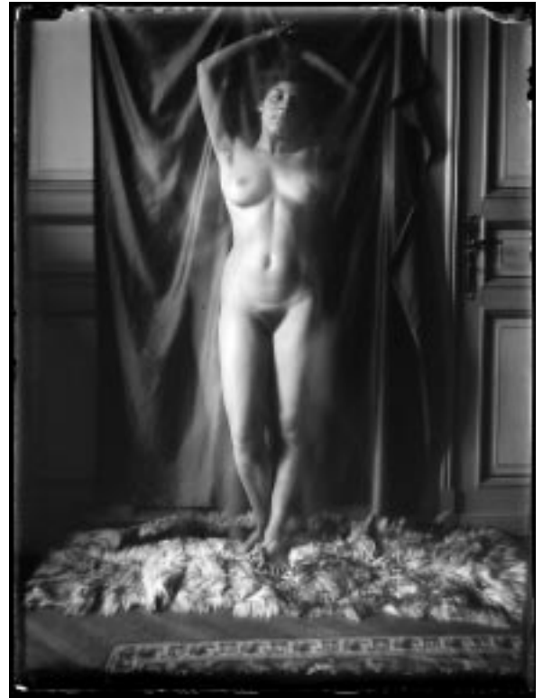
Foto boven: Zelfportret, foto gemaakt door Katharina E. Beherend, Hannover 1908 (‘Dutch Eyes’)

Verder zijn we de eerste gesprekken begonnen met het ‘Fotofestival aan de Maas’ om te kijken of we in 2008 een grotere amateurmanifestatie in het gebouw kunnen organiseren en presenteren. Er zijn ook veel amateurfotografen buiten de clubs. Zij