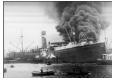
Rechts: Brandende s.s. Sommeldyck (H.A.L.) aan de Wilhelminakade

communiceren met name digitaal. Door middel van weblogs en met de nieuwe Photostart-website kunnen zij alles wat ze te melden hebben kwijt. Op deze wijze proberen wij een soort platform te worden voor die amateurfotografen.